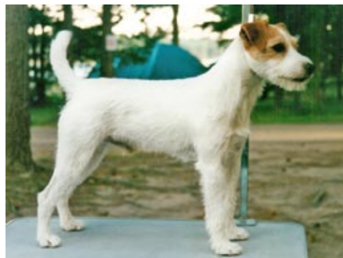
Emblasonen Buffy FinUCh SUCh SVCh Emblazy's Buffy Russet