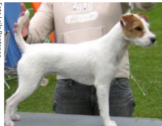
Buffys dotter Bixie

dom som lydnad, agility o.s.v. Problemet som kan uppstå är ju att man inte bryr sig om storleken längre om det skulle bli så.