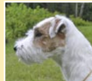
Jack-Daniel's Ägare: Solveig Thörnblom