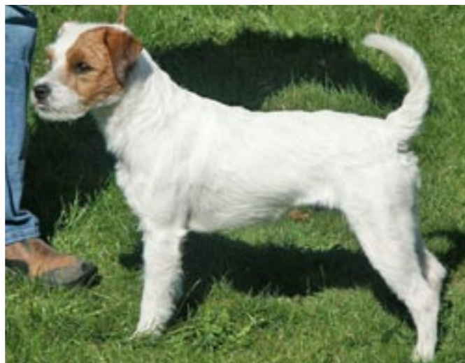
Mio, Emblazy's Fresh Prince, är Buffys barnbarnsbarn