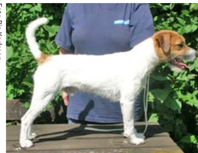
Taggens son Digger