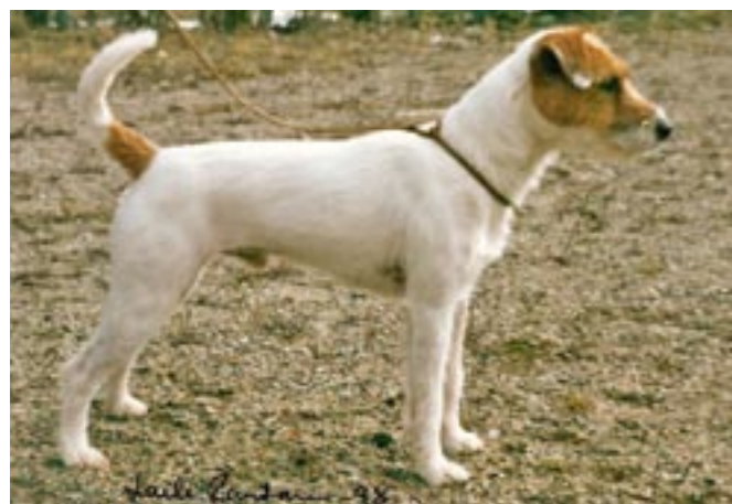
Emblasonen Taggen SUCh LP1 SJ(gs)Ch SVCh J Emblazy's Always Be On Target