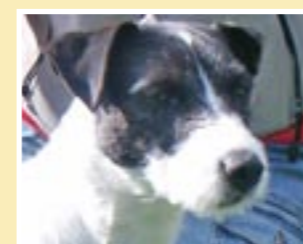
Radagast Bilbo Ägare: Tina Englund